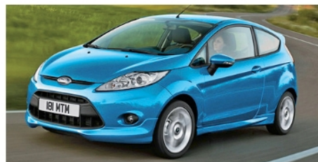
Ford Fiesta – Kat. A

Wählen Sie aus folgenden Fahrzeugklassen aus: