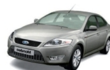
Ford Mondeo – Kat. C