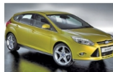
Ford Focus – Kat. B