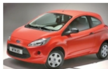
Ford Ka – Kat. O