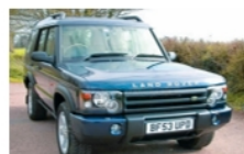
Land Rover – Kat. E